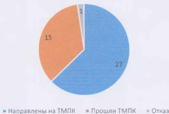
Диагностика воспитанников , прошедших ППк

По итогам мониторингов индивидуальных достижений воспитанников с ОВЗ и зачисленных по решению ТМПК в 2023 учебном году были выявлены следующие показатели динамики освоения образовательных программ.